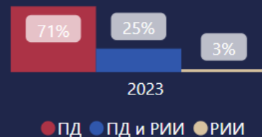
Распределение заключений по объекту экспертизы

■ В структуре услуг как государственной, так и негосударственной экспертизы преобладают услуги экспертизы проектной документации, их доля составляет 77% и 62% соответственно, при этом по сравнению с АППГ среди заключений государственной экспертизы наблюдается изменение на -0,7 пп , а среди заключений негосударственной экспертизы изменение на -4,5 пп доли данных услуг.